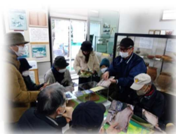
考古館 研究員のご説明に聞き入る