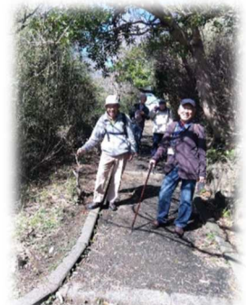
披露山公園から小坪へ

特記： 「春の嵐」通過のため13:00スタート。披露山公園展望台で雄大な相模湾の景色を眺めつつ、いまにもつぼみをひらこうとする桜や春の花々を楽しんでいるとすっかり汗ばむ陽気となった。「日本のビバリーヒルズ」を抜けて小坪漁港・逗子マリーナ・住吉城跡を散策した。