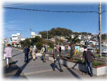
逗子マリーナでひと休み