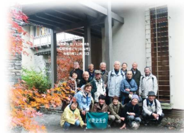
俣野別邸(正面玄関)

特記：横浜市西南部にある俣野別邸を訪ねた。現在の建物は昭和14年創建の建物を一部焼失後に再建した歴史建造物で、和洋折衷住宅として高い評価を受けており昭和の面影を満喫できた。例会終了後、藤沢の「まつだ家」で米寿のお祝いと懇親会を実施した。