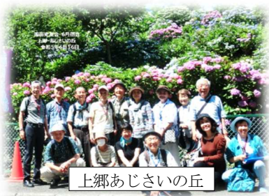
上郷あじさいの丘

・コース： 大船駅笠間口前バス停 ～（金沢八景行き）～ 八軒谷戸 ～ あじさいの丘 ～ 西ヶ谷 ～（神奈中バス：港南台行き）～（本郷車庫）～ イタチ川遊歩道散策開始 = 證菩提寺拝観 = イタチ橋（大及び小）= イタチ石像（川中）= イタチ川遊歩道散策終了 ～ 本郷台駅（天神橋付近で解散）