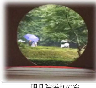
明月院悟りの窓 (長い行列で幻となった窓)