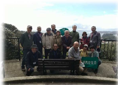
披露山公園展望台にて