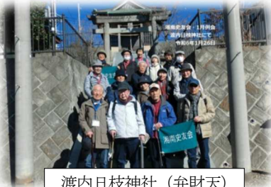
渡内日枝神社(弁財天)

・コース JR大船駅＝(バス)＝柄沢神社～渡内日枝神社～二伝寺～村岡城址～高谷石塔群(高谷大神宮・貝帰坂)～村岡東石塔群(昼食)～小塚洞碑～新村岡駅予定地～宮前御霊神社～川名(解散14:40分)～(解散後、川名御霊神社)