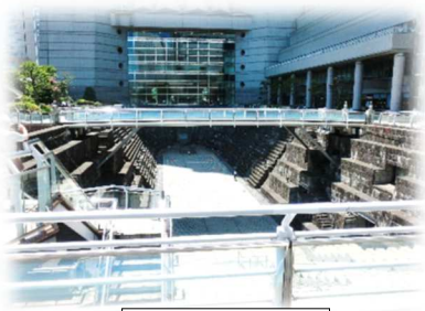
ドックヤードガーデン

特記： 明治初期に日本初の鉄道駅(旧横浜停車場)であった桜木町駅・『旧横ギャラリー』に立ち寄り、鉄道創業時に走行していた蒸気機関車等を見学。横浜第2の高層ビルの46階展望ロビーより“みなとみらい地区”の絶景を鑑賞した後、重要文化財である『帆船日本丸』と横浜港の歴史的遺産である『ドックヤードガーデン』などの建造物を探訪した。